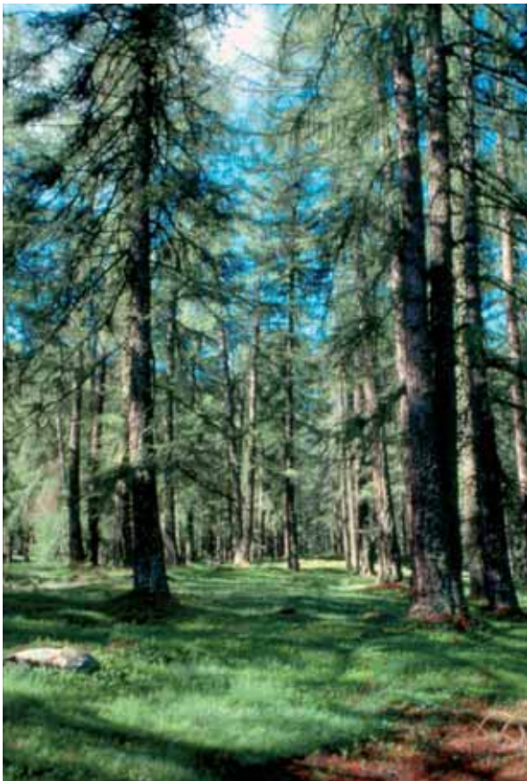
Lärchenwiese - Altrei

Eine Kulturänderungsgenehmigung hat eine Gültigkeit von fünf Jahren . Wenn innerhalb dieser Frist der Bauleitplan nicht abgeändert wurde, so ist ein komplett neues Gesuch um Kulturänderung einzureichen. Verlängerungen der Gültigkeit sind laut derzeitiger Gesetzeslage nicht möglich. Wenn innerhalb der Gültigkeitsdauer des Bauleitplanes keine Baukonzession für die Durchführung der Arbeiten erlassen wird, verliert