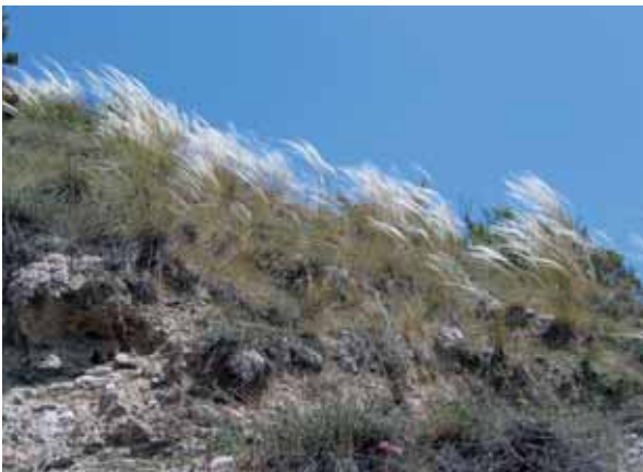
Trockenrasen mit Federgras, Sonnenberg bei Eysr

Trockenrasen sind trockene Formen von Magerrasen und entwickeln sich auf betont trockenen nährstoffarmen Standorten mit häufig nur gering entwickelten Bodenprofilen. Die Standorte liegen oft auf südlich exponierten, wasserdurchlässigen Hängen. Aber auch kiesig-sandige Flachlandböden mit gutem Sickervermögen begünstigen die Entwicklung von Trockenrasen. Das meist schon spärliche Niederschlagsangebot wird schnell abgeführt bzw. verdunstet. Aufgrund von Trockenheit und Nährstoffarmut siedeln sich auf Trockenrasen Pflanzenarten an, die eine hohe Trockenheitsresistenz besitzen. Der Trockenrasen als Pflanzengesellschaft kommt in der Natur nur sehr kleinräumig vor, wurde aber durch eine extensive landwirtschaftliche Nutzung (einschürige Mähwiesen oder Schafweiden) begünstigt. Die Trockenrasen sind Rückzugsgebiet gefährdeter Tier- und Pflanzenarten. Viele Arten der Roten Liste leben hier.