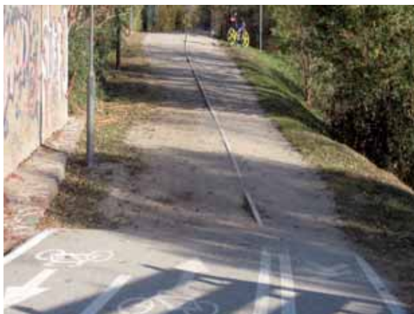
Wasser gebundene Decke

Weiters sind extensiv oder intensiv begrünte Dachflächen besonders geeignet der Versiegelung entgegen zu wirken, da sie die Regenabflüsse mindestens um 50 % reduzieren.