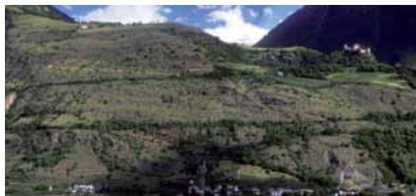
Sonnenberg ober Staben

treme Hitzegrade ergeben. Auf den Trockenrasen vermögen sich deshalb nur Spezialisten zu halten. Dazu zählen die Gräser mit ihrem weit reichenden Wurzelsystem. Über die beste Anpassung verfügen die Sukkulenten . Das sind Pflanzen wie Hauswurz-, Steinbrech- und Mauerpfefferarten, die in den fleischigen Blättern das Wasser speichern. Bei Trockenheit können sie die Wasserabgabe extrem einschränken. Moose und Trockenfarne können Dürreperioden in ausgetrocknetem Zustand überleben.