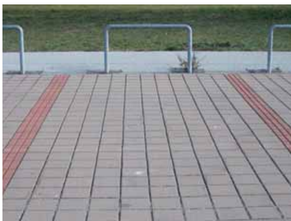
Nicht begrünte Pflasterdecke