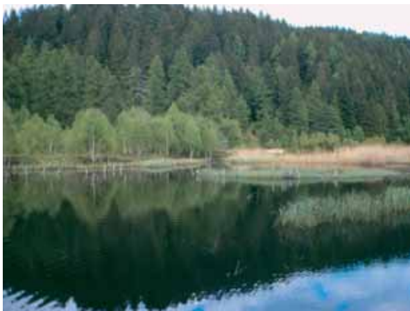
Langes Moos - Altrei