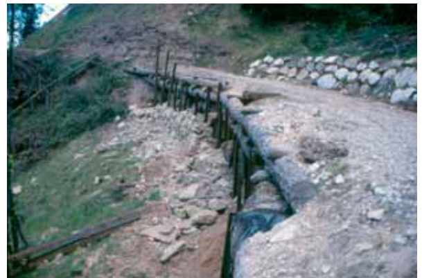
Straßenbau im Wiesertal

Das gebietsmäßig zuständige Forstinspektorat und