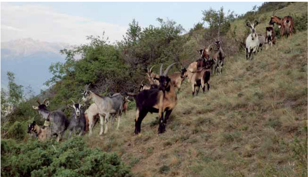
Ziegenherde beim Weiden