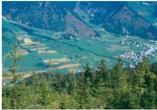
Blick auf Kulturlandschaft

die Ermächtigung für die Kulturänderung ihre Wirksamkeit und das Grundstück wird in die ursprüngliche Flächenwidmung zurückgeführt.