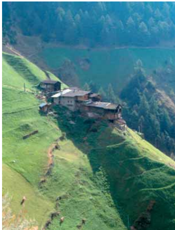
Höfe am Sonnenberg

Diese sind laut Forstgesetz nicht zwingend vorgeschrieben , sie können jedoch vorgeschrieben werden. Laut LEROP jedoch sind Aufforstungen im Ausmaß von mindestens 1 zu 1 Pflicht . In der Praxis sind Aufforstungen als Ausgleich eher schwierig umzusetzen, da einfach die Flächen fehlen. Mancherorts ist man dazu übergegangen, als Ausgleichsmaßnahmen die Errichtung von kleinen Feuchtgebieten, die Erhaltung und Reparatur von Trockenmauern, die Pflege von Heckengürteln usw. vorzuschreiben. Bei größeren Kulturänderungen, z.B. bei Skipisten, wurden Geldbeträge als Ausgleich eingefordert, welche für Waldverbesserungsmaßnahmen in der Umgebung Verwendung fanden.